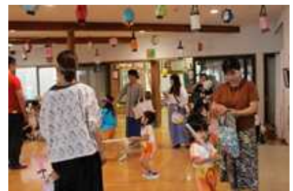
七夕 夏祭り幼稚園

らっしやると思っています。 本校の子供には、そのようなことがない よう学級担任が計画的に宿題や課題を出 し、夏休みを過ごせることを願い指導して います。どうか家庭でもお子さんへのお声 かけをよろしく願います。 結びに、夏休みに向け、事件事故が起こ らない事を願うとともに、子供に危険を回 避できる力と自分の身は自分で守るとい う意識を高めていけるよう学校でも指導して います。家庭でも、外出の際には、行き先や帰宅時刻の確認、交 通ルールを守ることや暗くなる前にお家に帰るなど、遊び方の約 束をしっかり決めていただきますようお願いいたします。 それでは、子供一人一人にとって、健康で有意義な充実した夏 季休業となることを願っています。